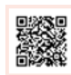
Formulaire en FR