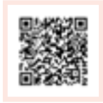
Formulaire en FR