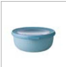
Box „Luloop“ Taille : 750 ml