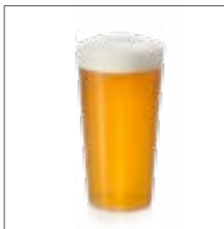
Becher Soft / Bier Größe : 0,3 Liter

Gastronomisches Material, das gegen eine Kautions von der Gemeinde ausgeliehen werden kann solange der Vorrat reicht (bitte Anzahl angeben):