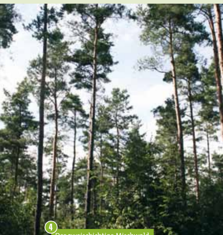
4 Der zweischichtige Mischwald