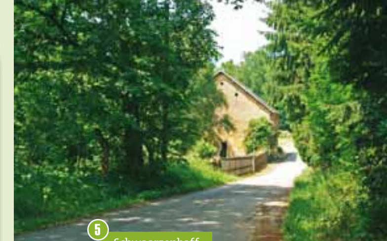
5 « Schwaarzenhaff »