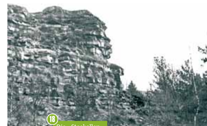
18 Die « Steekollen »