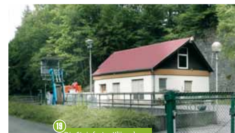
19 Die Steinforter Kläranlage