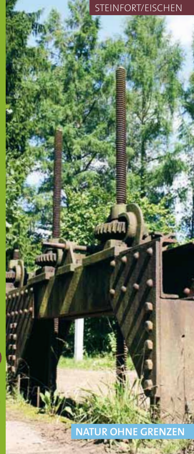
NATUR OHNE GRENZEN