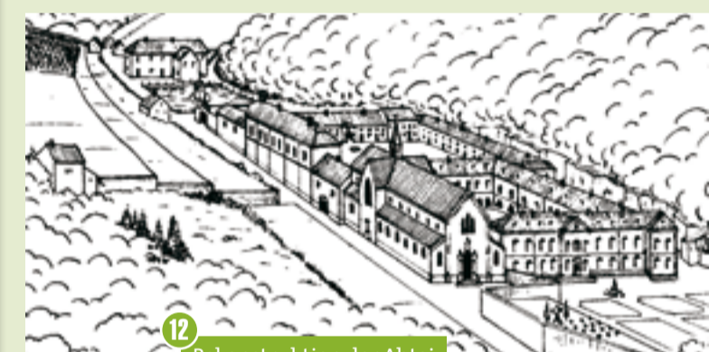
12 Rekonstruktion der Abtei