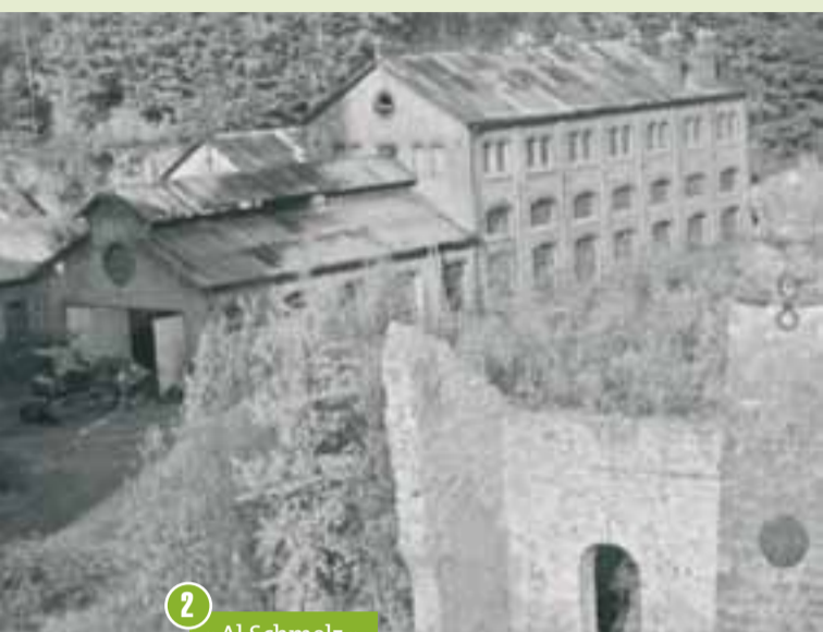
2 « Al Schmelz »