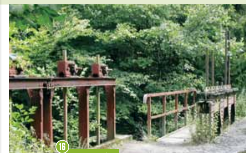
16 Das Stauwehr