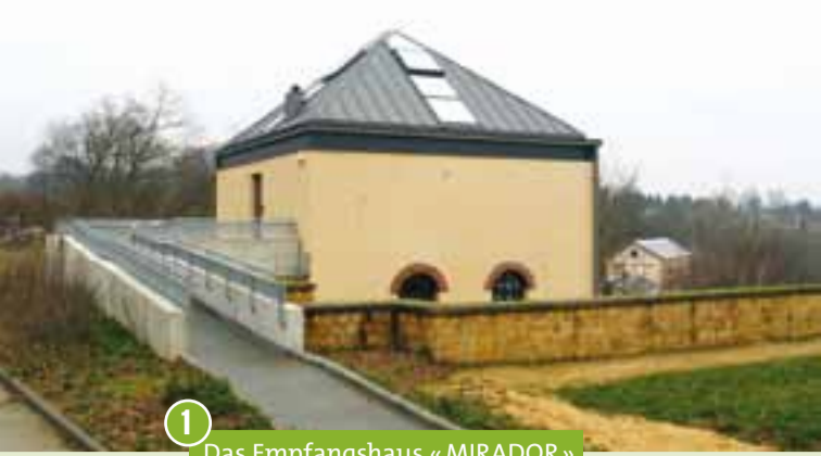
1 Das Empfangshaus « MIRADOR »