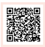
Formular auf DE