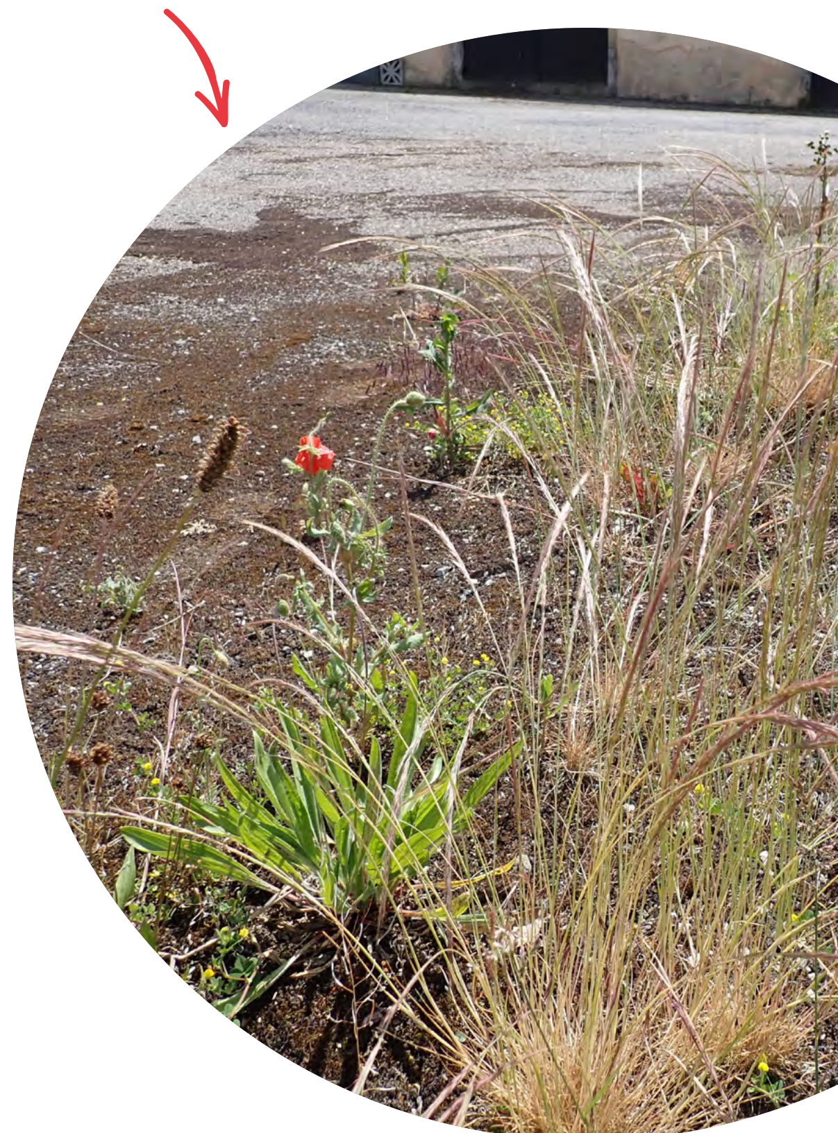
„WILDES GRÜN“ MIT MÄUSESCHWANZ- FEDERSCHWINGEL

Zwar sind die Pflanzen entlang des Weges selten geschützt, trotzdem sollten wir sie weiterwachsen lassen und nicht abpflücken. Die wildwachsenden Pflanzen bieten nicht nur Lebensraum und Futter für Insekten und weitere Tiere, sondern auch eine natürliche, lebendige Atmosphäre für uns alle.