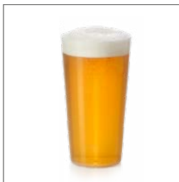
Becher Soft / Bier Größe : 0,3 Liter

Gastronomisches Material, das gegen eine Kautions von der Gemeinde ausgeliehen werden kann solange der Vorrat reicht (bitte Anzahl angeben):