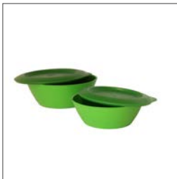
Schüssel „Ecobox“ Größe: 500 ml