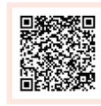
Formular auf DE